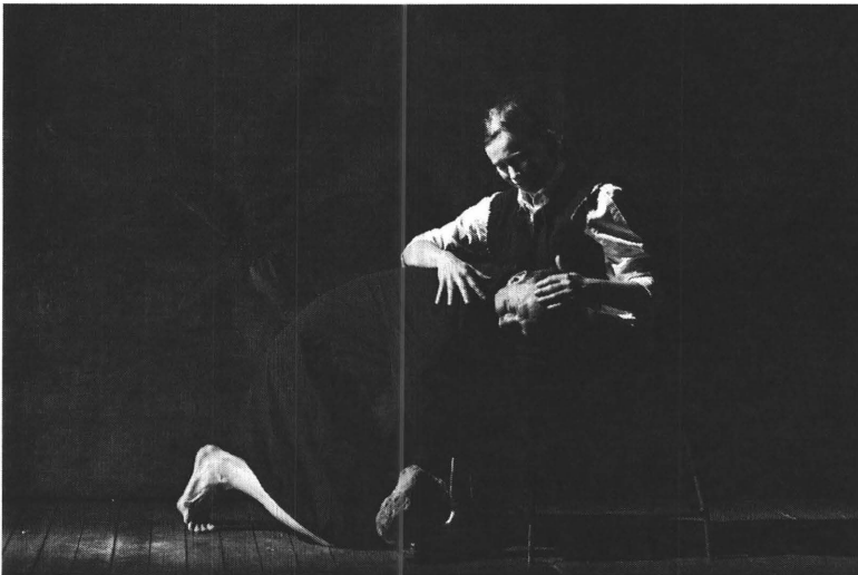
“Timon van Athene” door De Roovers

Tegenover de gedreven, impulsieve Timon staat de cynische filosoof Apemantus. Hij is net zo geïsoleerd als Timon maar hij doorziet de hebzucht en corruptie van de samenleving. Ook Alcibiades is een personage dat apart staat. De relatie van zijn verhaal met de plot over Timon is een van de onduidelijke aspecten van het stuk. Het enige wat de twee figuren gemeen hebben is dat ze zich verstoten voelen door de Atheense gemeenschap.