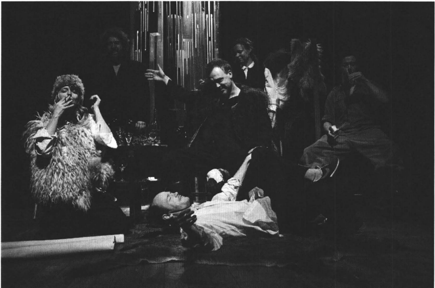
“Timon van Athene” door De Roovers

Timon of Athens is inderdaad een problematisch stuk om verschillende redenen. Hoewel het opgenomen werd in de eerste uitgave van Shakespeares verzameld werk –de First Folio van 1623– neemt men thans aan dat het de vrucht is van collaboratie met Thomas Middleton. Maar het ziet er naar uit dat het niet helemaal afgewerkt is gebleven. We hebben trouwens ook geen weet van enige opvoering in Shakespeares tijd. De plot bevat twee verhaallijnen, de ene over Timon en de andere over de bevelhebber Alcibiades, die vrij los van elkaar staan. Beide werden ontleend aan North's vertaling van Plutarchus. Men situeert het ontstaan van het werk omstreeks 1607.