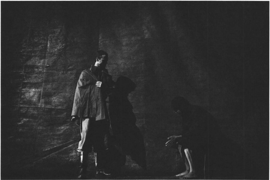
“Timon van Athene” door De Roovers

van de factoren waardoor dit stuk niet erg overtuigend lijkt. Nochtans zit in deze “tekorten” juist de sleutel die tot een beter begrip en een sterke productie kan leiden. De vrij simpele structuur die berust op de tweedeling in het verhaal van Timon en op bezoeken van diverse personages aan hem evenals de wijze waarop de figuren geconcipieerd zijn doen erg denken aan de moraliteiten. We moeten het stuk dus door een allegorische bril bekijken. In deze context is het natuurlijk des te opvallender dat Timon wel degelijk een diepere, zelfs tragische dimensie heeft. Zijn lange tirades waarin hij de mensheid vervloekt geven uitdrukking aan een visie waarin de hele wereld in chaos verkeert en alle morele waarden op hun kop staan. Deze obsessie met de ondankbaarheid en de bestialiteit van de mens sluit nauw aan bij de visie van King Lear, al blijft ze veel beperkter. Natuurlijk begaat Timon geen fouten die vergelijkbaar zijn met Lears fatale beslissingen, maar ook hij vertoont een verschrikkelijke blindheid voor de ware aard van de hem omringende wereld. In het tweede deel miskent hij zelfs de oprechte loyaliteit van zijn trouwe dienaar.