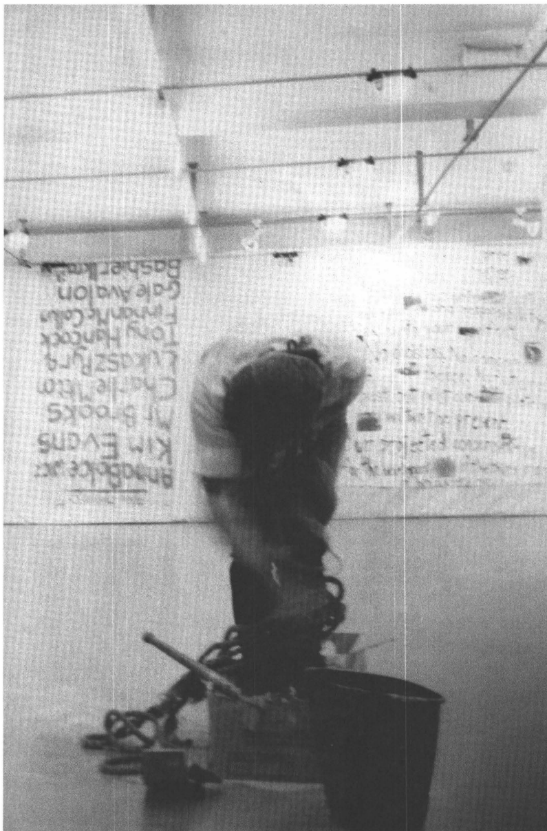
Performance Hugo Roelandt, fotograaf onbekend, 1978, persoonlijk archief Thomas Crombez