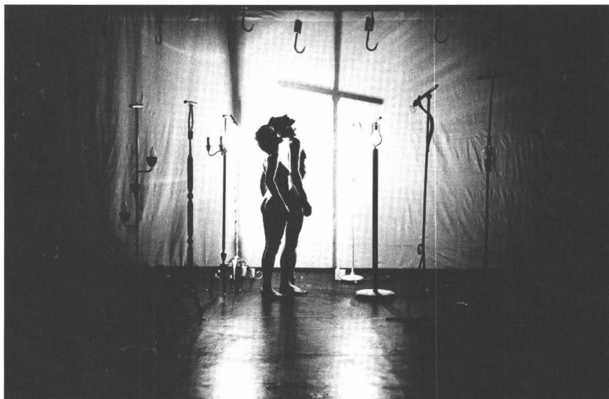
Het is theater zoals te verwachten en te voorzien was, Jan Fabre

Het inventariseren van deze massa gebeurtenissen is het onderwerp van een onderzoek dat nu reeds een jaar aan de Universiteit Antwerpen loopt. Onder de titel Belgium is Happening werd een register aangelegd van avant-gardetheater, happenings, concerten en performances (uit literatuur, experimentele muziek, beeldende kunst en toneel) tussen 1960 en 1990. Dit materiaal, voorlopig ca. 1.400 evenementen, wordt toegankelijk gemaakt via een volledig doorzoekbare databank op de onderzoekswebsite http://theater.ua.ac.be/belgiumishapp . In dit opstel wil ik van het project enkele voorlopige onderzoeksresultaten presenteren. Ik zal niet de hele periode 1960-1990 bestrijken, noch alle disciplines die in het register aan bod komen, maar een specifieke subgroep van evenementen belichten. Dat zijn de opvoeringen die meestal als performance art in de strikte zin geklasseerd worden: interventies door individuele kunstenaars (meestal afkomstig uit de beeldende kunst) die zich vooral manifesteren vanaf de vroege jaren zeventig – dus duidelijk ná de collectief georiënteerde happenings van de late jaren zestig – en die tot de vroege jaren tachtig doorgaan. In de tweede helft van de jaren tachtig kan men zeggen dat de belangstelling van kunstenaars voor performance afneemt. Dat heeft ontegenzeggelijk te maken heeft met de absorptie van een aantal performance-elementen binnen de boomende podiumkunsten (de zogenaamde Vlaamse Golf). Het bekende ijkpunt van die wending is het acht uur