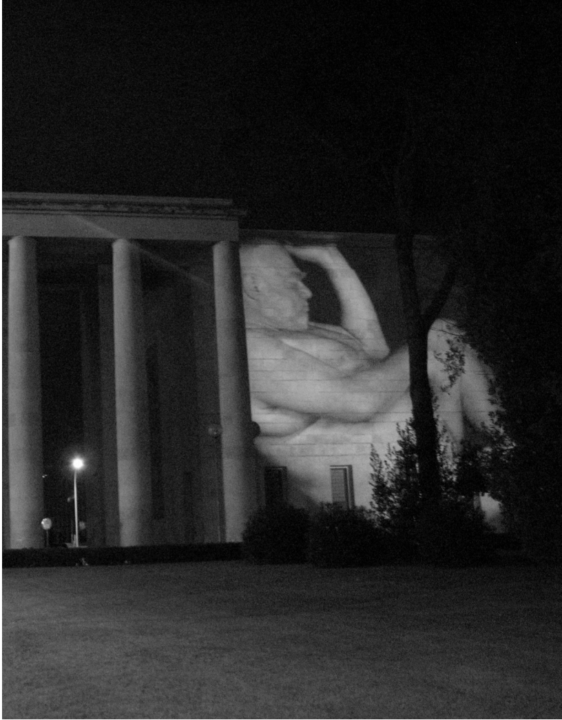
Fig. 2: STILLS I, EUR, Rome. © Kris Verdonck