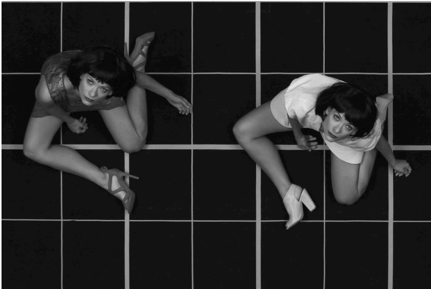
Fig. 4: ISOS, "Two Tawnys" © A Two Dogs Company