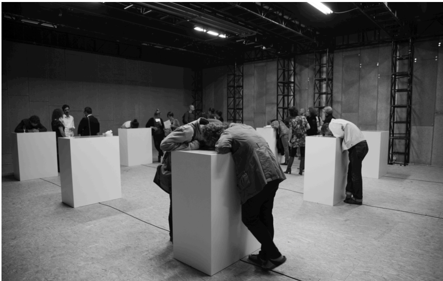
Fig. 7: Vernissage ISOS