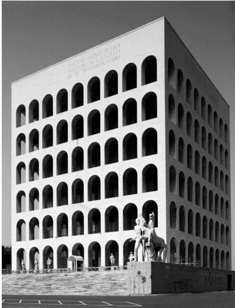
Fig. 1: Palazzo della Civiltà Italiana, EUR, Rome