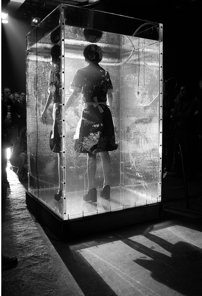
Fig. 5: IN