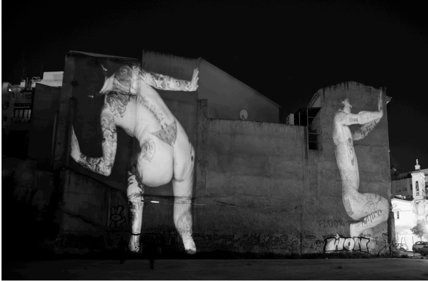
Fig. 3: STILLS: IV en V