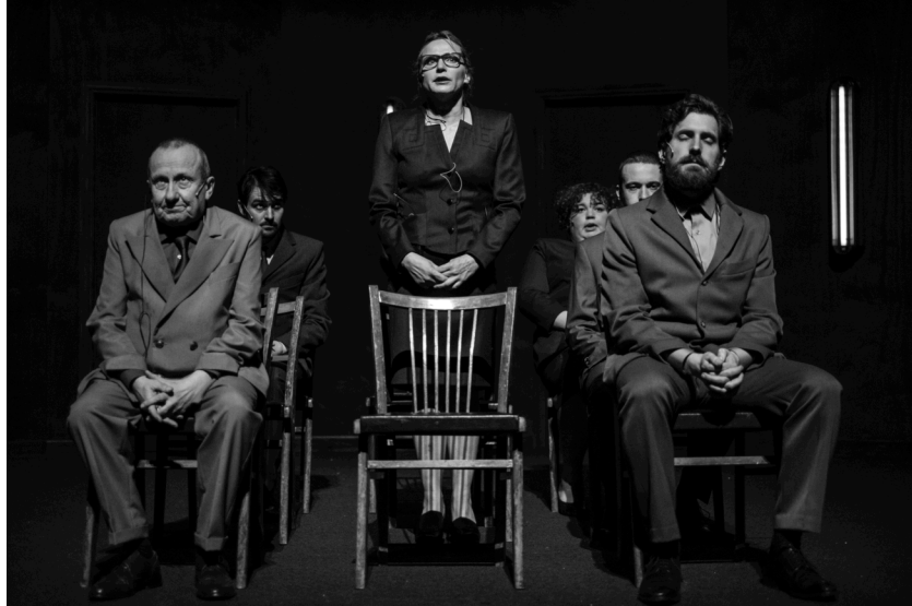
Memento Park