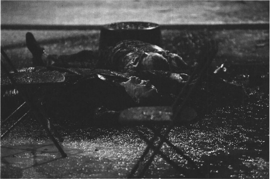
"Al mijn zonen"

Geen wonder dat Delpeut zich aangetrokken voelt door het werk van de Amerikaanse grootmeester. In zijn talrijke pakkende drama's toont Miller immers stevast individuen die vastlopen in de tegenstrijdigheden van het bestaan en die door morele keuzes verscheurd worden. Vaak gaat het om de individuele verantwoordelijkheid en schuld in de context van politieke of sociale problemen. Dat is ook het geval in All my Sons , het stuk waarmee Miller in 1947 doorbrak. Met Toneelgroep Amsterdam en Toneelschuur Producties bracht Delpeut een sterke interpretatie van het stuk in een originele vormgeving.