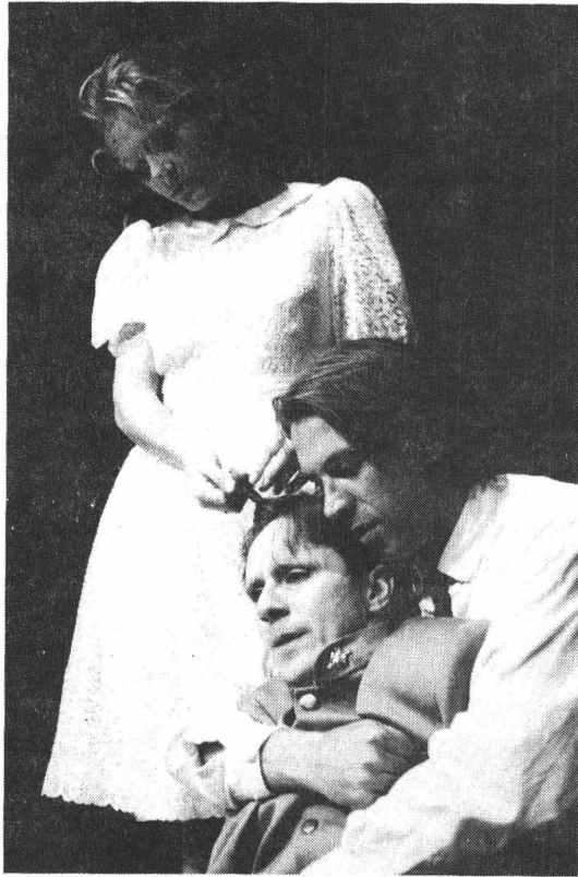
"Victor" door Teneeter, Nijmegen