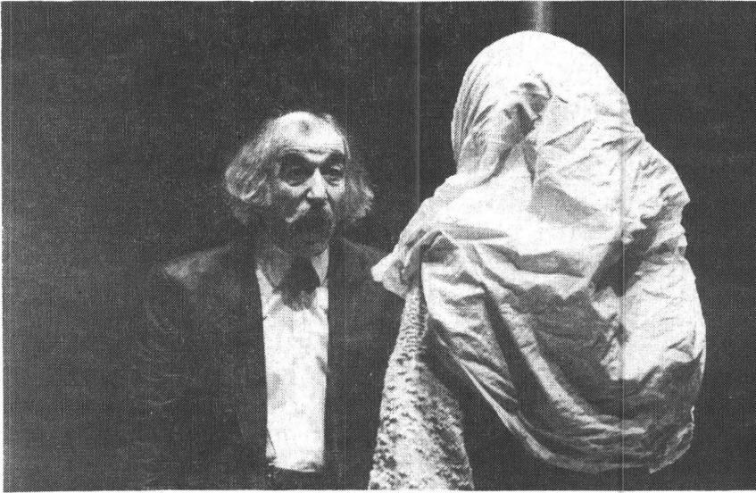
"Hänschen Klein" door Theater Spilksichte, Basel