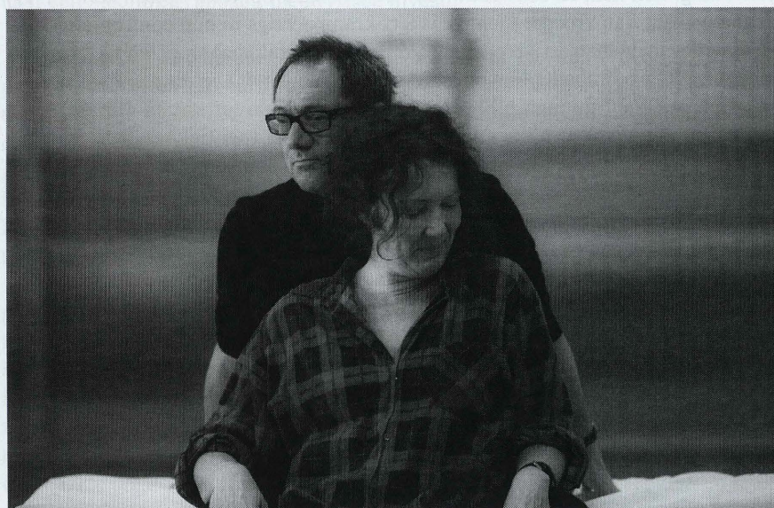
“Nooit van elkaar”

Een museum of een kerkhof? Musea zijn huizen die gedachten herbergen, zei Proust. Het leven, de ongebreidelde passie en het verlangen die volop aanstoten tegen de obscene onderbreking van de begrafenis. Generaties die telkens opnieuw opduiken en verdwijnen. De dood die zijn rechten opeist en tenslotte Een museum: een lege zaal waarin lichamen elkaar hinderen en elkaar raken.