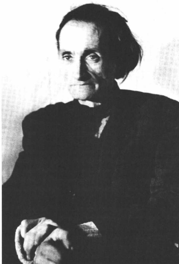
Artaud, kort voor zijn dood in 1948

Drie jaar later volgt een iets langer toneelstukje, ( M ) oratorium , later opgenomen in Claus' eerste verzamelaar Acht toneelstukken (1966), met een onmiskenbaar artaudiaanse toonzetting. Vanaf de jaren zestig produceert Claus meerdere antieke tragedies in een sterk gemoderniseerde bewerking. Opvallend genoeg kiest hij in eerste instantie niet voor de als superieur beschouwde Griekse dichters, maar voor de gemaniëerde Latijnse leesdrama's van Seneca ( Thyestes , 1966; Oedipus , 1971; Phaedra , 1980). Weerom in het spoor van Artaud, want die had in 1932 eveneens Seneca, en eveneens Thyestes , bewerkt met het oog op het Theater van de Wreedheid. 14