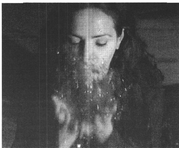
Uit: Medea no comment, video van Vouvoula Skoura