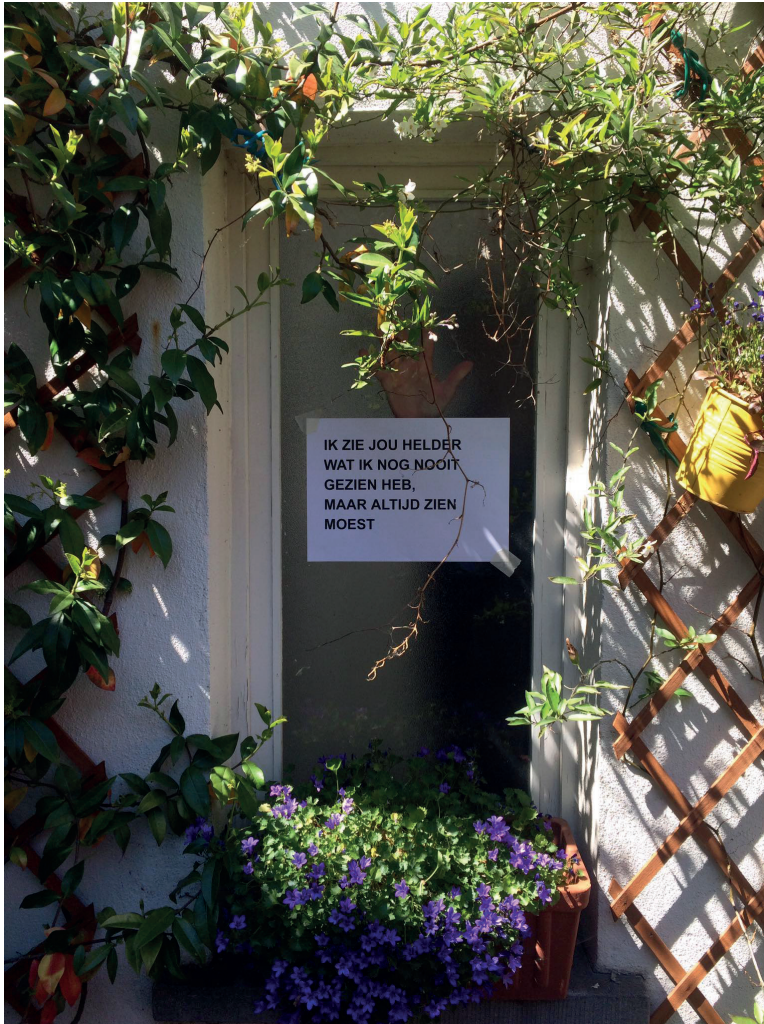
Afbeelding 1: Untitled I, © Paula Rodriguez Sardiñas, 2020.

"Doorheen alles zijn Wij het die veranderen In de andere"