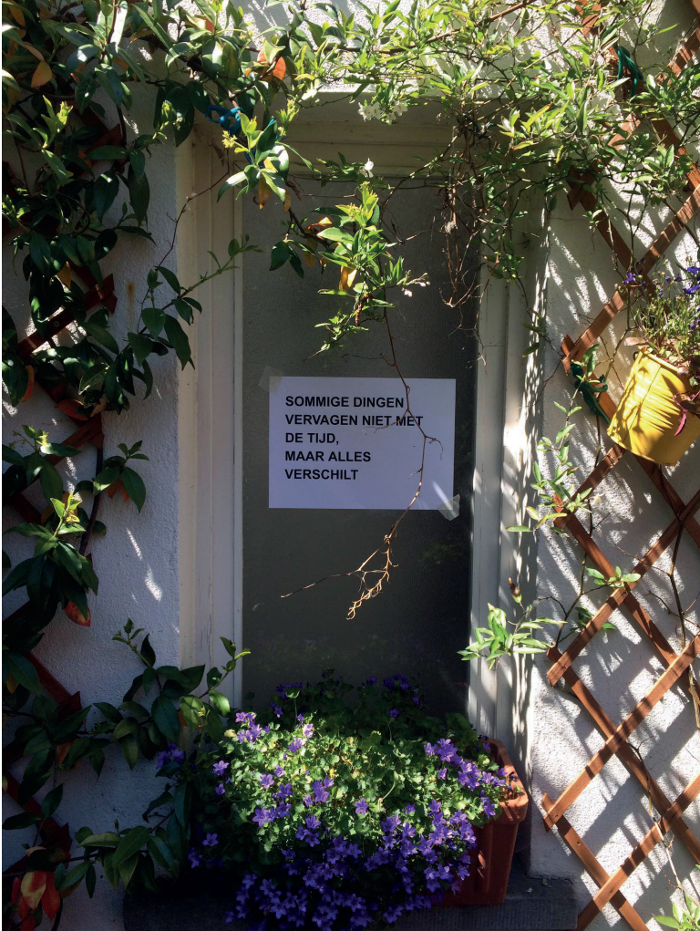
Afbeelding 2: Untitled II, © Paula Rodriguez Sardiñas, 2020.

"Sommige dingen Vervagen niet met de tijd Maar alles verschilt"