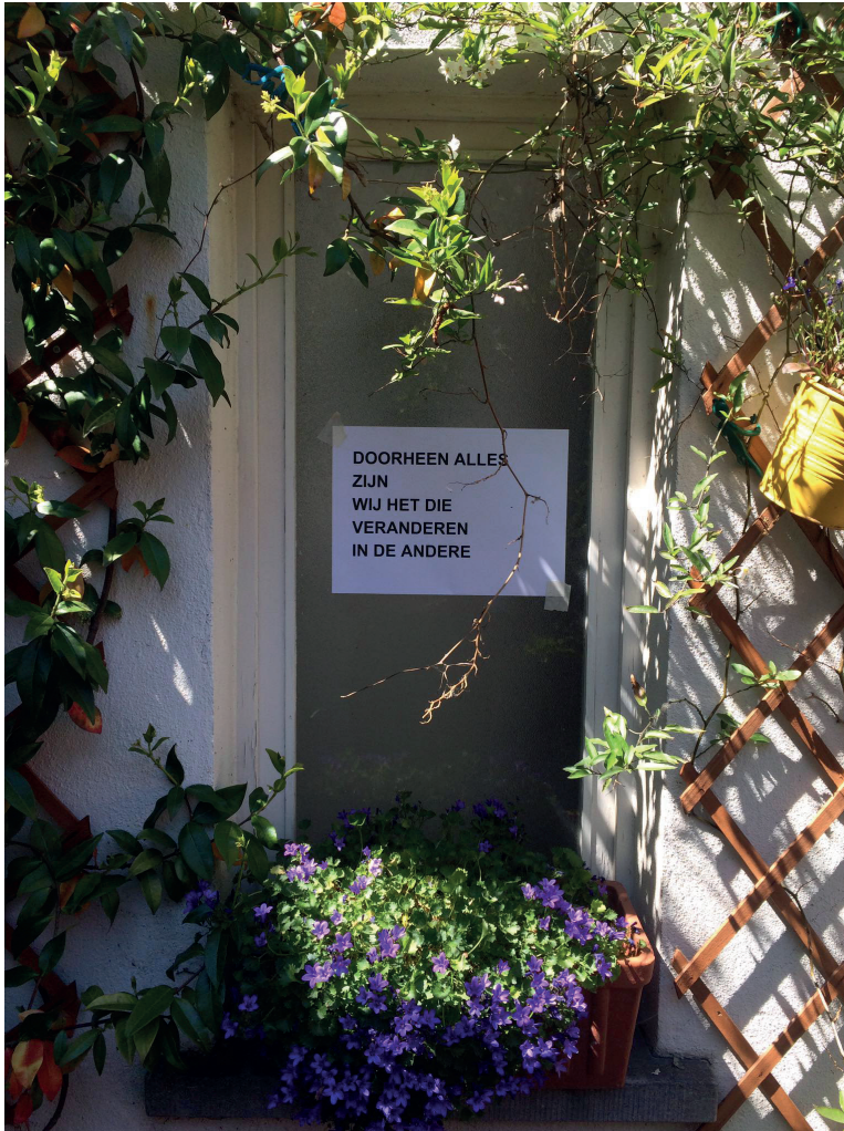
Afbeelding 3: Untitled III, © Paula Rodriguez Sardiñas, 2020.

"Ik zie jou helder Wat ik nog nooit gezien heb Maar altijd zien moest"